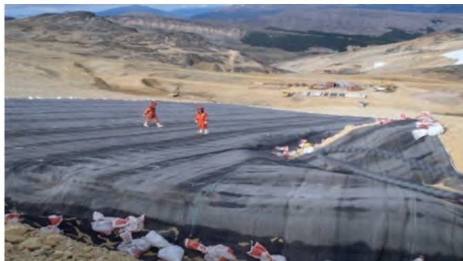
Установка геомембраны ►

Геомембрана COLETANCHE® не образует складок и морщин по причине низкого коэффициента температурного линейного расширения и не создает проблем при отсыпке защитного слоя грунта.